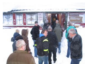
Julelunsj på Korgfjellet