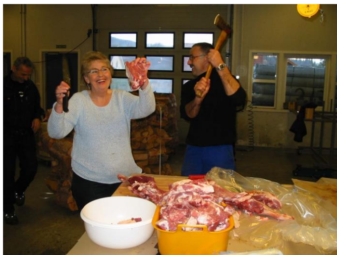
Partering av slakt til bruk i kantina ☺